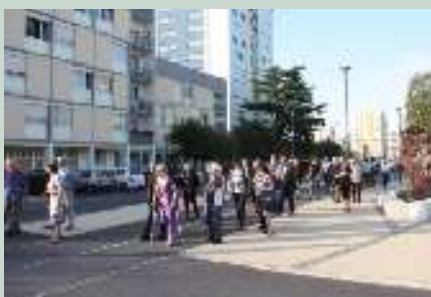
Les diagnostics en marchant