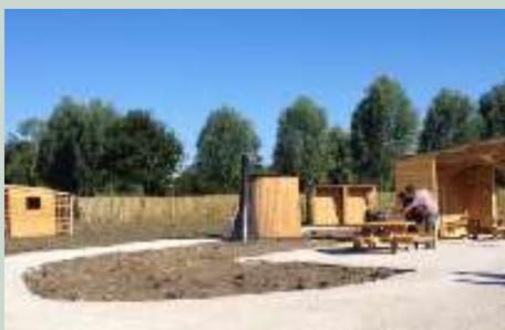
Les jardins familiaux, ouvriers ou partagés