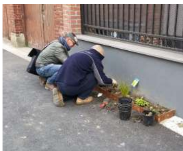
La plantation des pieds de façades