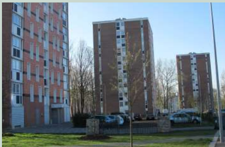
La résidentialisation des pieds d'immeubles