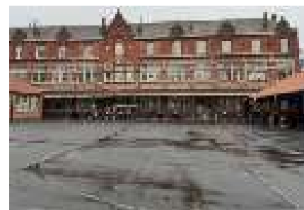
La revégétalisation des cours d'écoles