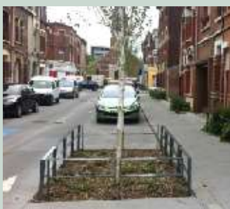
Les pieds d'arbres