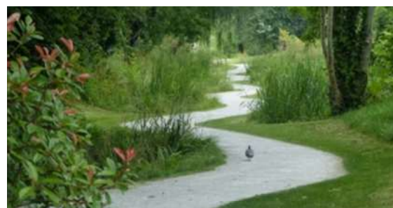
Les parcs, squares et espaces naturelles