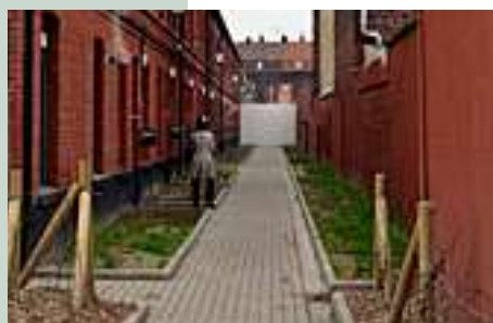
Les venelles et petites ruelles